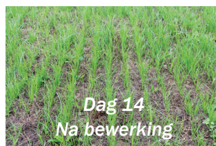
Dag 14 Na bewerking