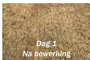
Dag 1 Na bewerking