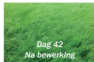
Dag 42 Na bewerking